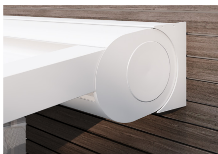
Profil mural de jonction en option