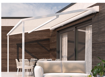
Eclairage LED possible