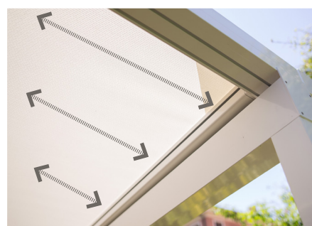
Technologie ZIP pour une parfaite tension de toile