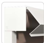
Coffre ouvert pour inspection